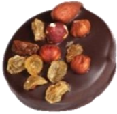
Mendiant noir Disponible novembre/décembre Praliné amande