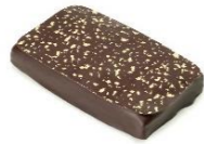
Extrême noir Ganache amère éclats fèves de cacao