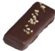
Saint-Louis Pâte d'amande pistache