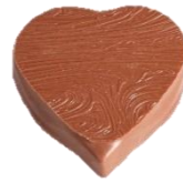
Cœur lait - noir Praliné amande