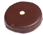
Carasel noir Ganache caramel beurre salé A la fleur de sel