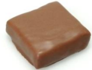
Le Guérande lait - noir Praliné aux éclats de caramel beurre salé