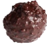
Rocher lait - noir Praliné amande