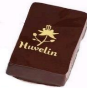
Fleur de cacao noir Ganache origine Sao Tom